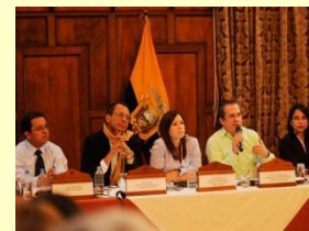
Ministros analizan alternativa a los TLC

CONAVE cuenta con el asesoramiento del Observatorio de Comercio Exterior OCE, organismo especializado en Negociaciones Internacionales, de esta manera se analizan los procesos que están en marcha para definir sugerencias a las Autoridades del Gobierno para que sean tomadas en cuenta de conformidad con la sensibilidad que tiene la cadena productiva maíz, soya, balanceados, avicultura. Ver artículo sobre cada negociación